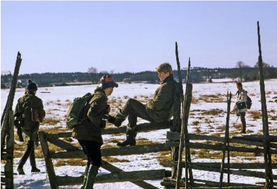
På väg in på Marsäng.