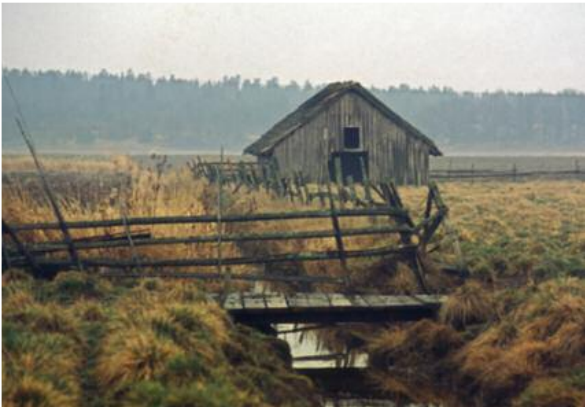
Den stora ladan.

Den stora ladan låg längst bort i nordost, utmed diket. Här betade då kor. Numera är det enbart ogräsmark, där rovfåglarna har bra jaktmarker efter sork. I bakgrunden ser man de brukade markerna, nu är det mest vall som odlas i det område som ligger närmast ladan.