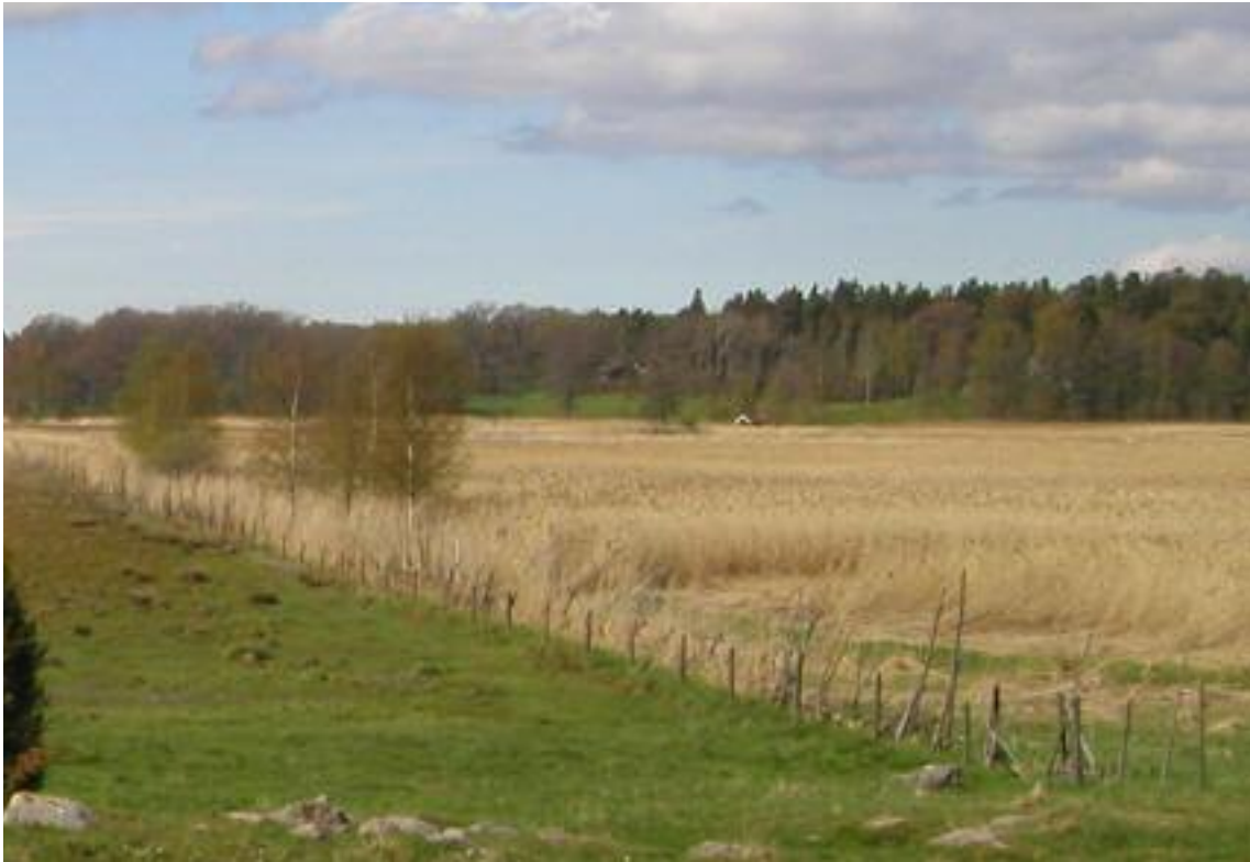
Bild från lilla berget mot Slängaviken 2010. Den lilla ladan låg till höger, längst ner i bilden, på bortsidan av staketet. Inget syns längre av den. Observera hur mycket vass det är nu, jämför med bilden på föregående sida. Bilderna är tagna ungefär i samma årstid, vår mot sommar.