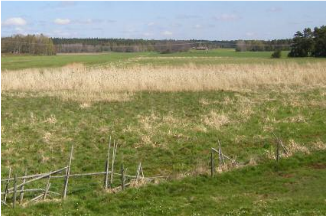
Här hur det ser ut 2010, tuvmark och vass dominerar. Bilden tagen från det lilla berget.