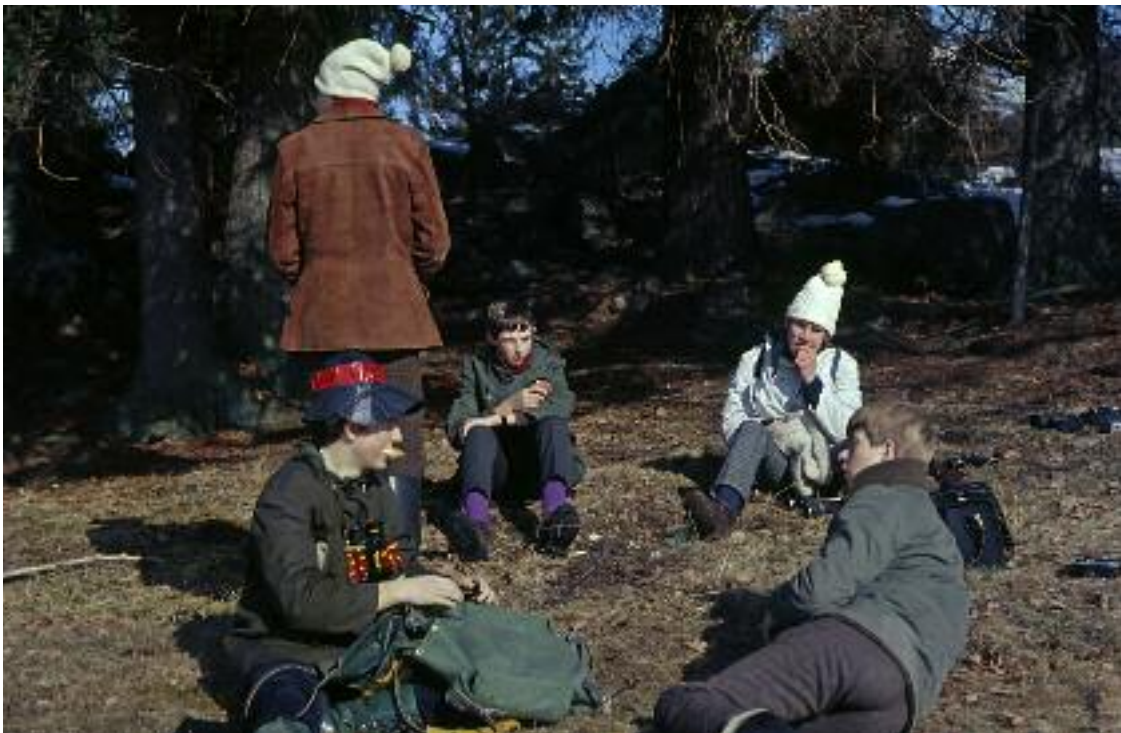
Matsäcken måste ju också intas, varför inte på solsidan.